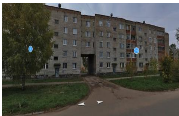
2. улица Лебедева