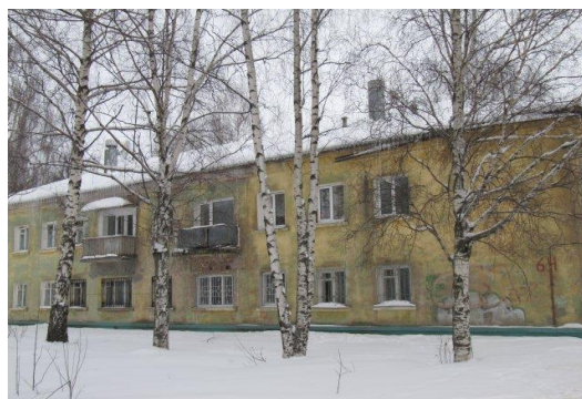
4. улица Кольшкіна