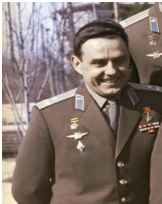
Владимир Михайлович Комаров (1927 — 1967)

Владимир Михайлович появился на свет в марте 1927 г. в Москве.