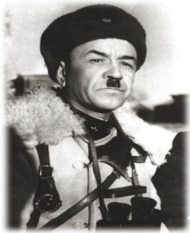
Панфилов Иван Васильевич (1893-1941)

Родился в 1893 году в городе Петровск ныне Саратовской области.