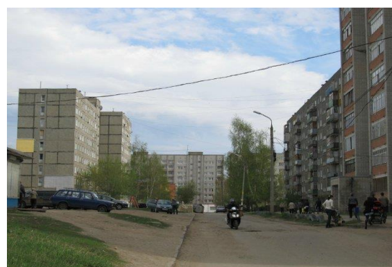
3. улица Комарова