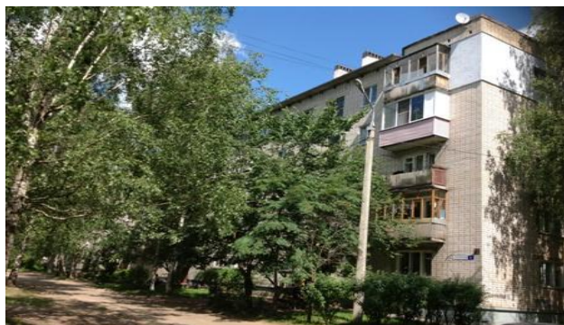
1. улица Панфилова