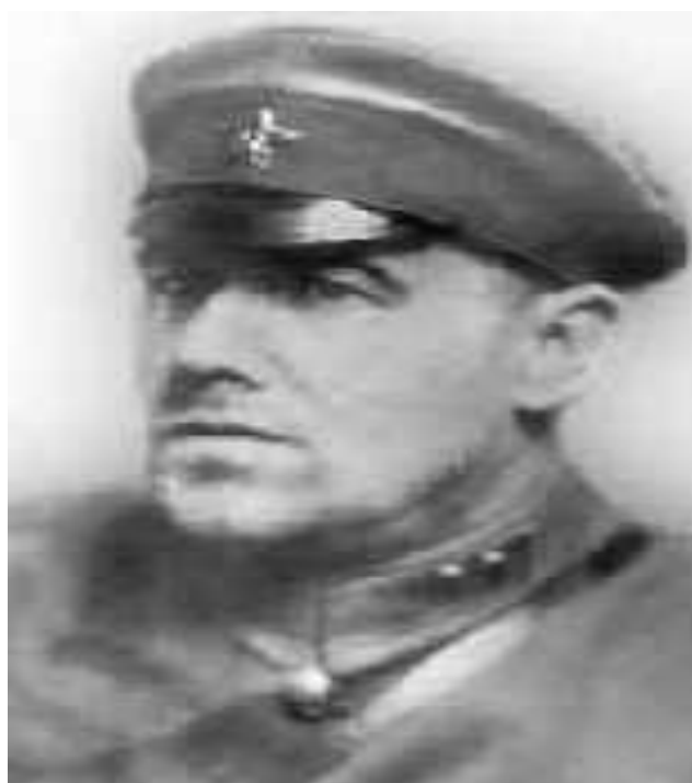
Лебедев Михаил Иванович (1884—1971)